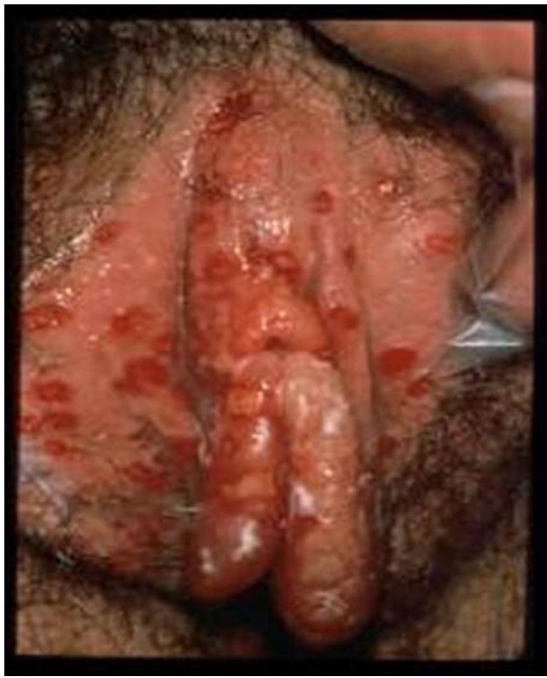
Figura 1. Lesiones ulcerosas en vulva. Modificado de Garland y Steben 13 .

anogenitales. Conforme a estos cambios, debemos romper con la tradicional afirmación de que VHS-2 es igual a herpes genital y que el VHS-1 se limita a infecciones orolabiales con transmisión no sexual.